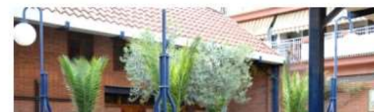
En 1964 se constituyó canónicamente la parroquia.