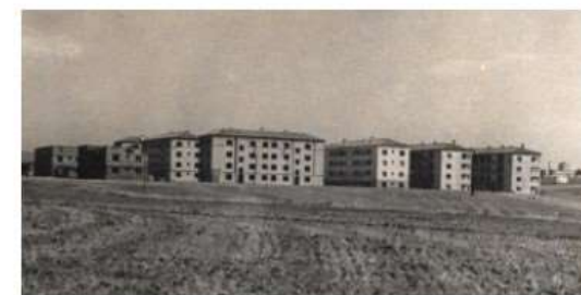
Los franciscanos llegaron a Campoamor el 30 de abril de 1949.