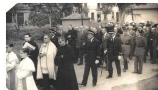
El 5 de octubre de 1952 se puso primera piedra del Colegio e Iglesia en la calle Pizarro.